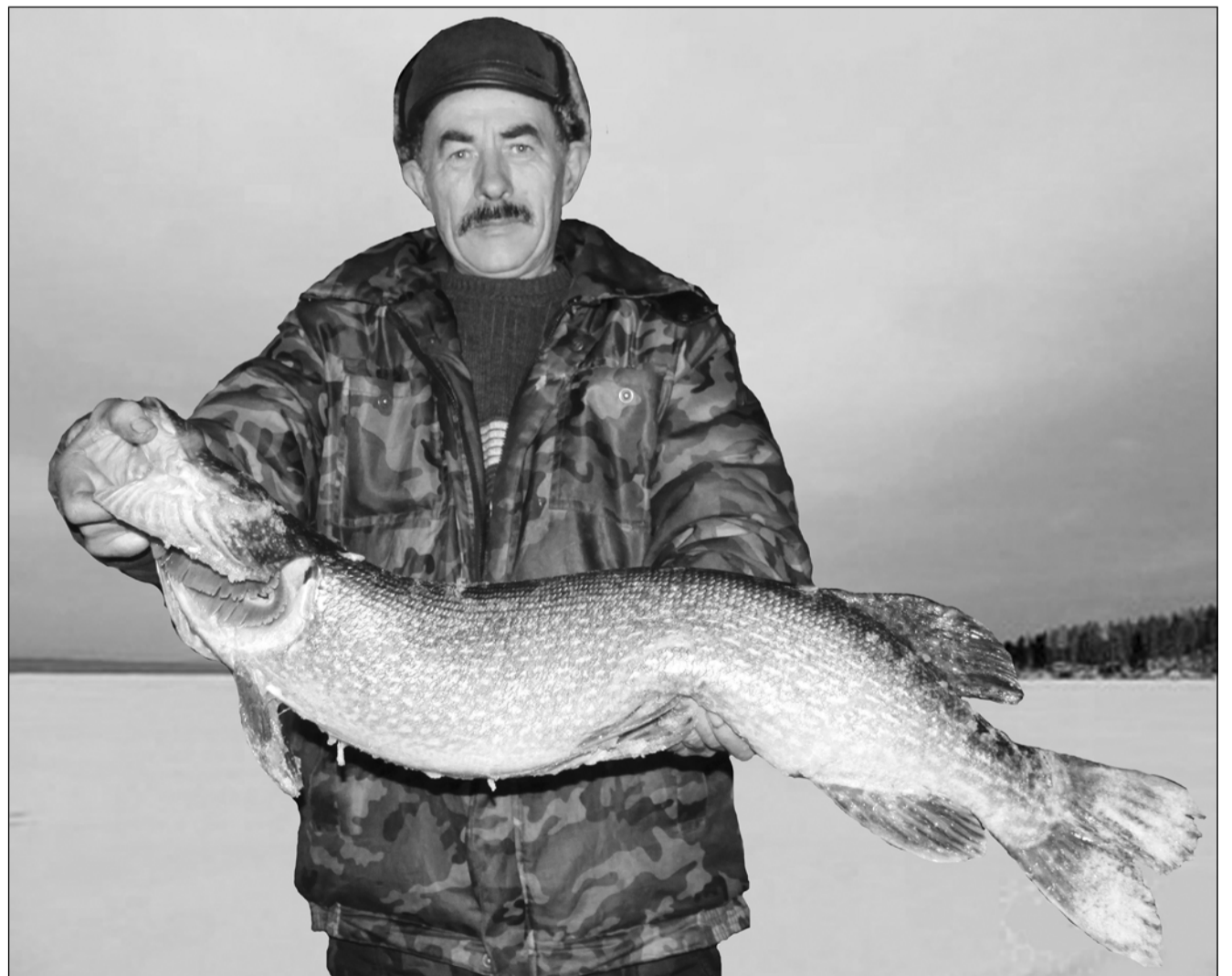
» ФОТО ЭТЮД. УДАЧНАЯ РЫБАЛКА. Вот такая пятнистая хищница водится в реках Варненского района